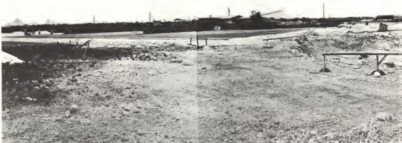
Planta di Purificacion di Awa usa, unda tin alrededor di 16